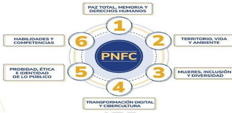
Gráfico 2: Temáticas